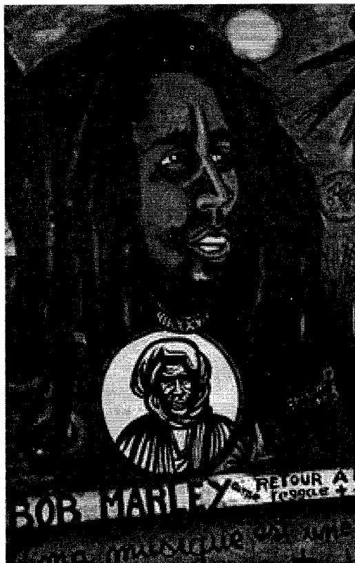
Fig. 5. Detalle de un mural en Belaire, Dakar pintado por Papisto Boy. Del cuello de Bob Marley pende la imagen sagrada de Ibra Fall, el discípulo más reconocido de Bamba y continuador de su obra.

manes. En los murales de Papisto Boy, por ejemplo, se recombinan y se funden elementos de muy diversas tradiciones culturales generando algo completamente distinto a la mera suma de sus componentes (Ver Fig. 5).