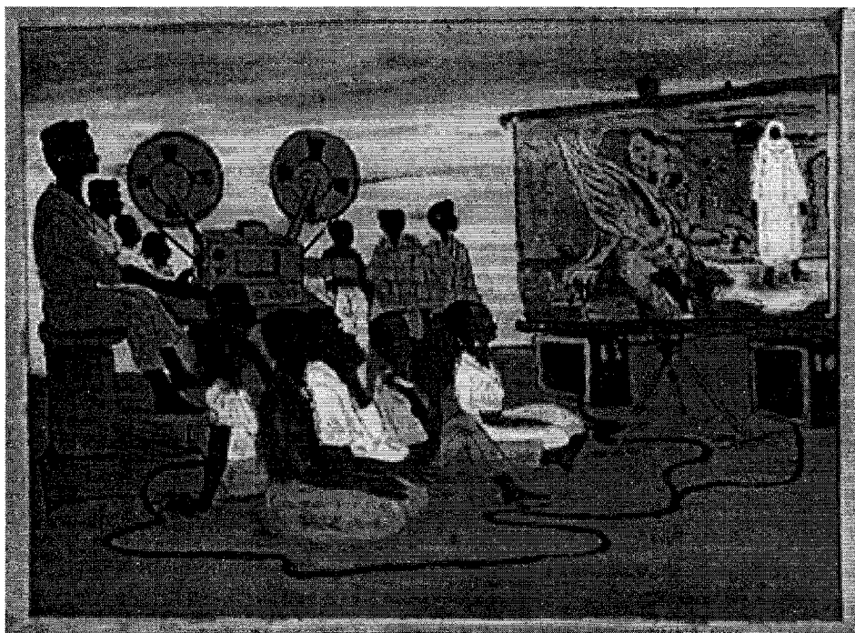
Fig. 3: Un grupo de jóvenes observan una película acerca de la vida de Amadu Bamba y aprenden de los hechos del santo. Vitral de autor desconocido (1999). Fowler Museum of Cultural History, UCLA.

A pesar de que la independencia fue en gran medida un proceso pacífico y sin mayores tensiones entre Francia y la naciente República de Senegal, los primeros años de la década de los Sesenta fueron decisivos para la consolidación de patrones culturales senegaleses contemporáneos. En este proceso fue decisiva la elección de Leopold Sédar Senghor como primer presidente de Senegal. Su larga presidencia (1960 – 1981) marcó las pautas