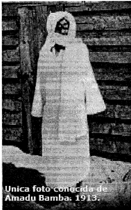
Fig. 1: Amadu Bamba, 1913.

Keywords: Islam, Africa, colonialism, resistance, iconography