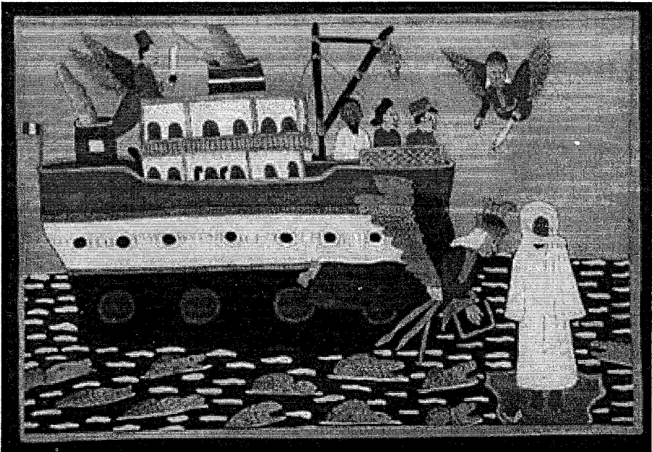
Fig. 2: Amadu Bamba rezando sobre las aguas, pues a bordo del barco que lo habría de llevar al exilio le había sido prohibido hacerlo. Vitral de Mor Gueye (1998), Fowler Museum of Cultural History, UCLA.

místico derivado del descubrimiento de facetas ocultas en la pintura, sino que también se esperaba educar a los nuevos devotos, a quienes posiblemente no conocieron al maestro, no solamente acerca de las vicisitudes del sheikh y la comunidad, sino también acerca de la religión en general. Durante los años Cuarenta, los artistas educaban acerca del Islam con sus pinturas 53 , y por tanto tuvieron un rol central dentro del orden social muridista. El artista plástico muridista comenzó a desempeñar el papel del bardo tradicional Wolof, aunque su discurso no se hacía a través de