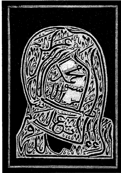
Fig. 4: Caligrama basado en la foto de 1913, producido en el estudio de Mor Gueye (1998); está compuesto por los nombres sagrados de Allah y Mahoma. Fowler Museum of Cultural History, UCLA.

sar en Amadu Bamba cuando se ve una imagen de él, trae inmediatamente bendiciones 56 . Algunos artistas han incorporado textos del Corán y qasidas de Bamba a las composiciones para reforzar su poder y realzar su dimensión mística. Estos caligramas transforman al objeto, a la imagen presentada, en una verdadera oración 57 . Las letras y pasajes del caligrama se pueden leer de muchas maneras. Puede ser a través de la numerología, o poéticamente o buscando ciertos significados ocultos de la imagen (Ver Fig. 4).